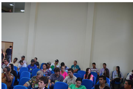
Imagem 01. Curso Meio Ambiente e Resíduos Sólidos.

leram o material de apoio e debateram entre si, levantando as problemáticas do município em face ao tema proposto, e quais seriam as medidas mitigadoras que poderiam ser aplicadas no âmbito municipal.