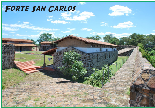
FORTE SAN CARLOS