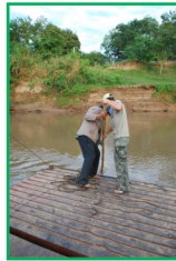
ATRAVESSANDO A FRONTEIRA