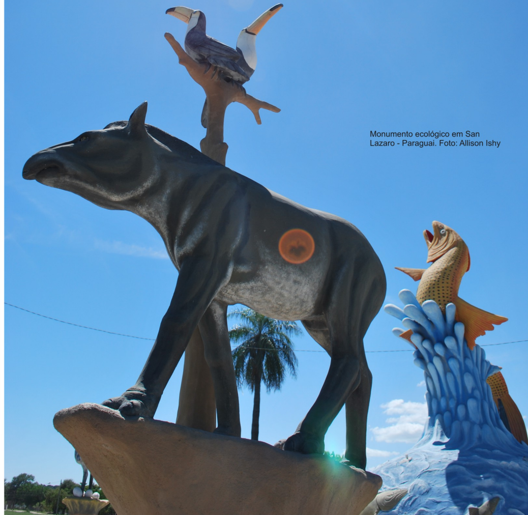
Monumento ecológico em San Lázaro - Paraguai.